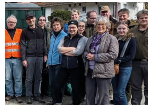
Die Dreck-weg-Mannschaft des PNF und weitere Helfer

Natürlich veranstaltet auch Naurod daher regelmäßig einen Dreck-weg-Tag: Dieses Jahr fiel er auf Samstag, den 28. Februar. Neben dem Geschichts- und Heimatverein, den Jägern und der freiwilligen Feuerwehr hat sich auch der Partnerschaftsverein an dieser Aktion beteiligt. Mehrere gartenaffine Helferinnen nahmen