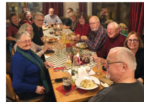
Stammtisch Dezember 2025