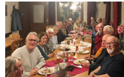
21 fröhliche Gesichter beim März-Stammtisch

Natürlich trafen sich die Mitglieder auch wieder bei den Stammtischen im „Weißen Ross“. Jeden zweiten Montag eines Monats finden sich gesprächs- und feierlustige Damen und Herren im Nebenzimmer zusammen, um sich über Gott und die Welt auszutauschen. Trotz der leider recht schlechten Akustik – man versteht schon den Gegenübersitzenden nicht wirklich – sind es meistens zwischen 12 und 16 Personen, die gemeinsam essen und trinken. Und manchmal bietet uns die Speisekarte auch Überraschung; neben der üblichen Hausmannskost gab es im Februar drei Gerichte aus der indischen Küche. Dieses Angebot haben einige ausprobiert und waren