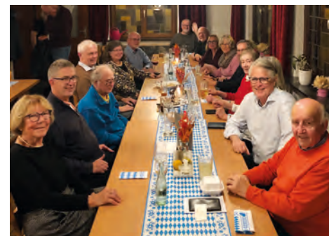
Stammtisch Oktober 2025