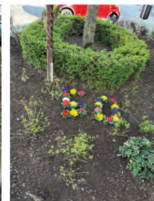
... und nachher!